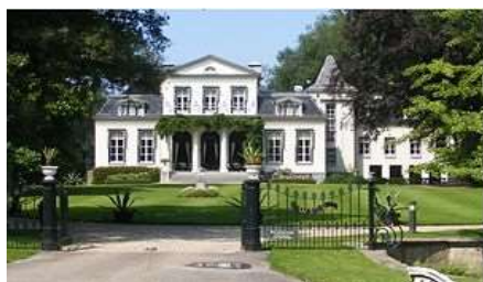
a. Oranjewoud c. Klein Jagtlust

Het parklandschap Oranjewoud is in opzet al in de 17 e eeuw ontstaan met de grote en kleine landgoederen van respectievelijk de Friese Nassaus en van hun hof functionarissen, de Van Harens. Daarna omgevormd in de 19 e eeuw als de drie landgoederen: a. Oranjewoud (met o.a. Pauwenburg en nu Prinsenhof), b. Oranjestein (met o.a. Oranjehoeve) en c. Klein Jagtlust. Daarnaast waren er kleinere buitens (Ontwijk, Brouwershave en Klemburg met nu Tjaarda's bos en de Belvédère) en het grotere buiten Veenwijk bij Oudeschoot in het zuid-westen van het plangebied. Ten oosten van Katlijk is ook een landgoed structuur van wat eertijds bij het landgoed Oranjewoud hoorde.