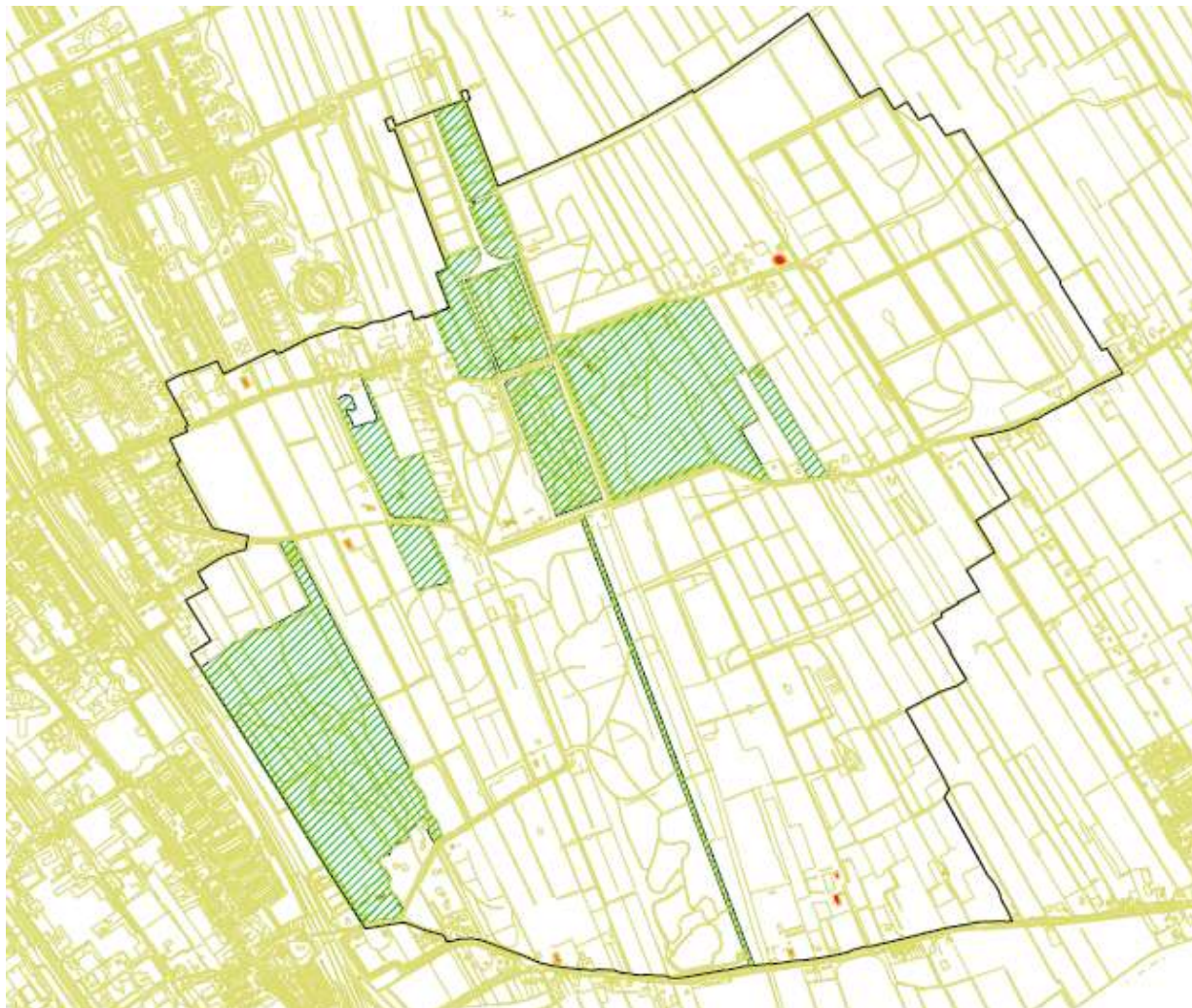
Kaart 4. Groen gearceerd, Rijksmonumenten terrein (uit ontwerp bestemmingsplan, maart 2013)

Het plangebied bevat naast de vele gemeentelijke monumenten (oude (landgoed) boerderijen en woonhuizen) ook vele Rijksmonumenten (zie kaart 4). Vanwege hun waarden hebben ze een beschermde status en voor het eventueel aanbrengen van veranderingen is een omgevingsvergunning nodig. Te noemen zijn de terreinen (park-, tuinaanleg) van Tjaarda's bos met Belvédère en (betonnen) toegangshek, Oranjestein, de Overtuin, 't Hof, de oude aanleg van het MLO met de Brink, complex Veenwijk met grafheuvel, -kelder en hek, Klein Jagtlust en de Flapsingel als langste laan in het gebied.